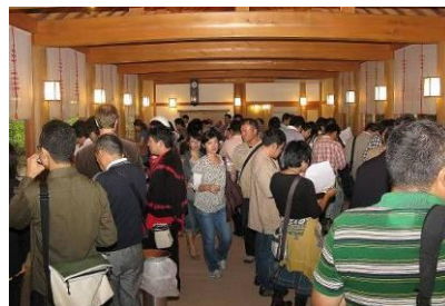
日本酒ファン殺到、「酒サムライきき酒会」