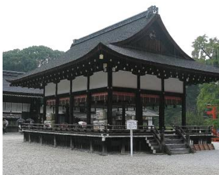
叙任式が行なわれた下鴨神社舞殿

もちろん、今回叙任された 6 氏も日本酒と日本文化を深く愛する「サムライ」の名に恥じない方々ばかり。東日本大震災で大きな痛手を受けた日本酒業界にとって、総勢 34 人に拡大したサムライパワーは「日本と日本酒の復興」を実現するための強力な推進力となることが期待されます。