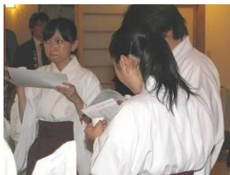
下鴨神社の巫女さんも参加

「IWC のことは知りませんでしたが、外国でメダルを取ったお酒って言われたらやっぱり飲んでみたくなります。満足しました」と語ってくれたのは、ボーイフレンドに誘われて参加したという女性。一方、来場者の対応に当たった日青協関係者も「外国で受賞したという話題性は特に若者にはアピールする。そういう反応が実際に市場を動かすようになるまで PR を地道に積み重ねていきたい」と手応えを語っていました。